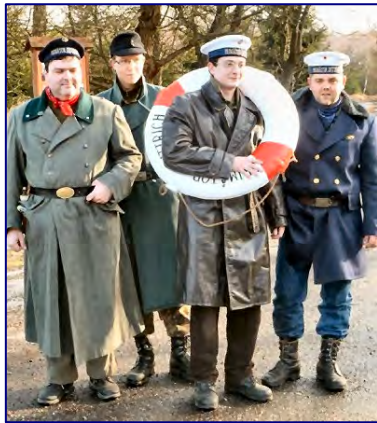
Junggesellenabschied in Moldava